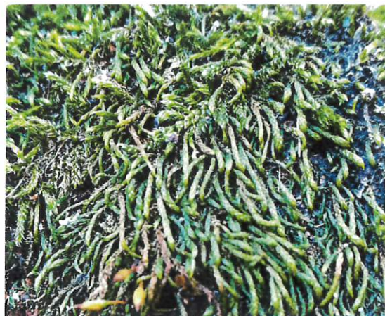
Pseodoleskea artariae su un vecchio muro vicino a Lugano

Raccomandiamo quindi di evitare pulizie troppo accurate, meccaniche o chimiche, di vecchi muri, fughe di pavimentazioni, elementi decorativi in pietra naturale, rocce. In tal modo si preservano l'effetto positivo dei muschi per l'uomo e l'ambiente, la ricchezza di specie e le specie in pericolo.